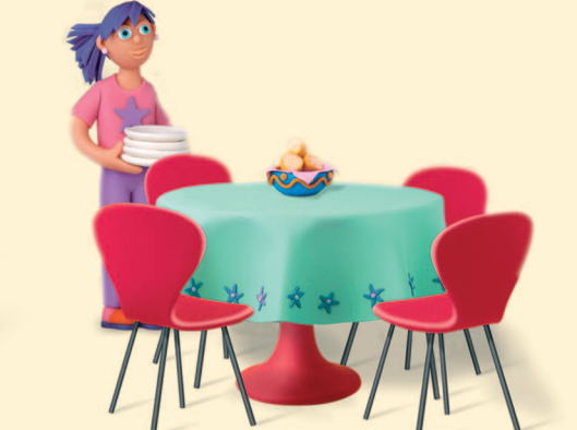
Plastilinas: Ana Vittalba