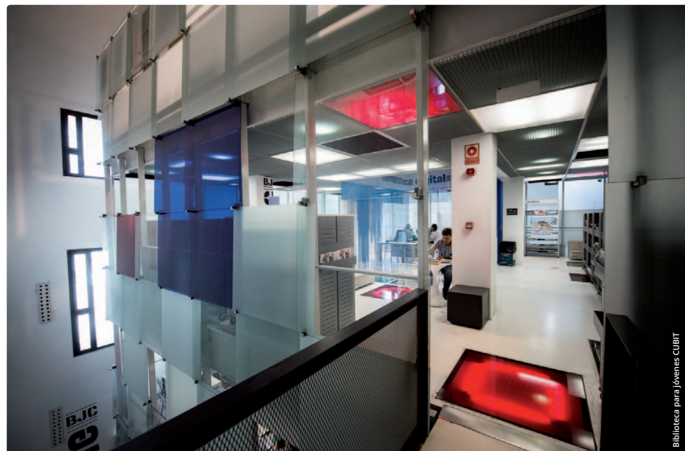
Biblioteca para Jóvenes CUBIT