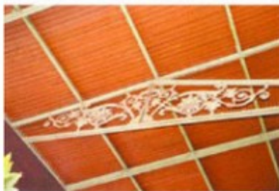
Detalles de la estructura interior, en hierro forjado, con motivos ornamentales

¿Y gracias a qué mecanismo todas estas plantas experimentan una transformación que los convierte, más allá de su inmediata capacidad alegórica de la prosperidad material y de la paz, en elementos de una simbología celebradora de la superación intelectual y moral? Es por obra del caduceo que reina entre todos ellos en este edificio consagrado a Mercurio. Es la acción de esa norma bajada del cielo, como lo expresa Félix Navarro, la que propicia una general transformación de la materia gracias a la cual sobrevive materialmente el género humano en materia espiritual gracias a la cual supera la inferioridad de lo que no se eleva del suelo. La presencia en el Mercado Central del dios Mercurio sería la clave del sentido de toda su ornamentación vegetal.