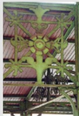
Viga de celosía decorada con una flor de girasol

Un grupo de siete plantas predominan en la decoración del Mercado Central: el girasol, la granada, el olivo, la neguilla y el berro de los prados, seguidas del trigo y la vid. Atendiendo no sólo a su cantidad sino también a su ubicación y a sus dimensiones, son el girasol, la vid y el trigo las que predominan en el interior del edificio (y el girasol la única que también está en el semisótano). El berro de los prados, por su parte, domina totalmente la decoración en hierro al exterior, como si de una cerca floral silvestre se tratase. Es importante advertir la absoluta ubicuidad del olivo y la granada, por más que por su tamaño no estén evidentes a primera vista. En cuanto al loto, su presencia en los capiteles de las columnas de hierro del semisótano (a los que da su forma) hace de ella también un motivo ornamental de primera magnitud. Seguramente, a parte de su belleza formal, su presencia tiene mucho que ver con el resurgir de motivos orientales en la literatura y el arte de la época, incluso con un cierto renacer del esoterismo.