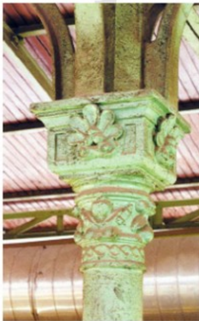
Columna de hierro coronada con granadas y conchas con perlas

En cuanto al adorno de motivo vegetal, aparte de la presencia alegórica de las figuras nombradas, Navarro explicó la presencia del trigo y la vid junto al escudo de Zaragoza (los típicos alimentos) y de los canastillos rebosando frutas, acompañados de las ocho letras de la palabra Zaragoza, de los capiteles de las arcadas laterales de las fachadas norte y sur (porque los productos de una región forman su carácter o nombre). Pero no detalló sentido de la presencia de todas las plantas representadas, algunas reiteradamente, a lo largo y ancho del edificio.