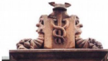
Caduceo símbolo de Hermes-Mercurio, dios

La decoración del Mercado Central, inscrita en su propia estructura, habla y explica el sentido de un edificio singular. La constituyen cuatro tipos de elementos: los relacionados con el dios Mercurio, los que simbolizan el trabajo y las tareas que contribuyen a la alimentación humana, los que exhiben productos concretos que se venden en este mercado y, por último, el conjunto de los adornos de motivo vegetal.