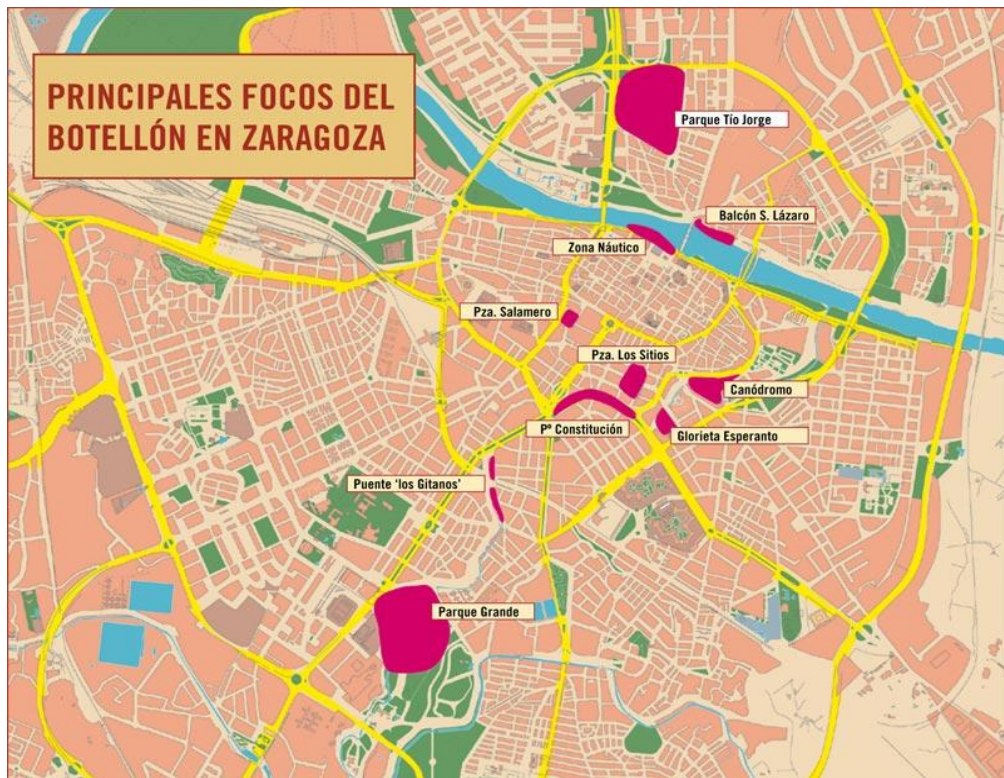
Zonas de botellón

Algunos lugares de Zaragoza son emplazamientos tradicionales del botellón desde hace años, como los bulevares de Constitución, el parque de José Antonio Labordeta, el puente de los Gitanos, el parque del Tío Jorge, la plaza de Los Sitios, la zona de Miraflores y el Parque Grande, siendo los tres últimos donde se registraban mayores concentraciones.