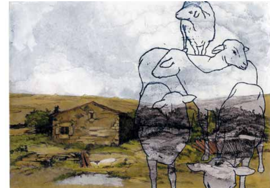
↑ Duce Baquero, Alberto . Adoración de los pastores , 1992. Aguafuerte y aguatinta sobre plancha de cobre, 205 x 290 mm