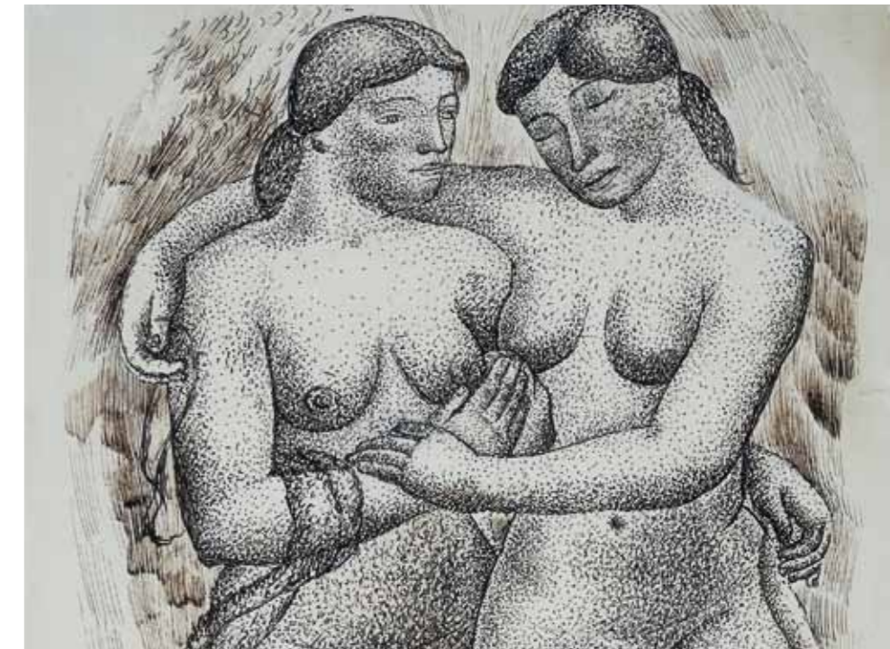
García Condoy, Honorio (Zaragoza, 1900-Madrid, 1953). Dos figuras de mujer , detalle, Bruselas 1937. Dibujo a tinta 340 x 220 mm. Colección Francisco Alegre, Zaragoza