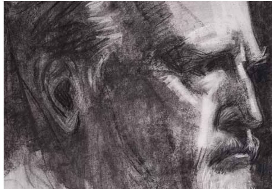
↑ Alvira Banzo, Fernando (Huesca, 1947). De Goya, detalle , 2018. Aguada de tinta china, carbón y barniz americana mate sobre papel. Ingres. Colección privada, Huesca